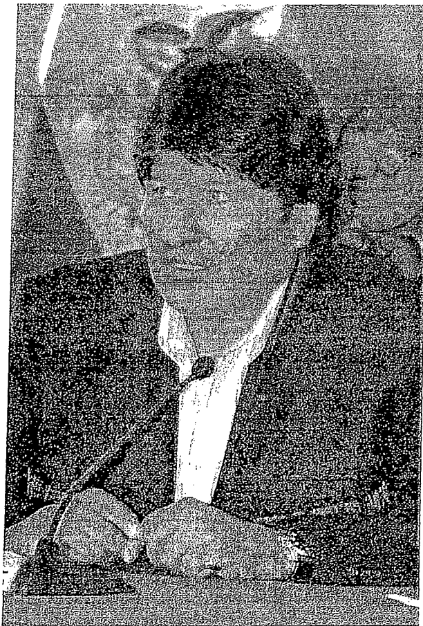
Morales ha iniciado numerosas reformas en un año.

vez, el gobierno del primer indígena elegido presidente se asienta en cuatro pilares: la evolución del Estado, el seguimiento de los grandes grupos empresariales de Santa Cruz, que no renuncia a convertirse en un territorio autónomo, los inversores externos y los movimientos sociales. Morales ha anunciado que "en compañías mixtas o capitalizadas una investigación encontró muchas ilegalidades sobre sus inversiones y su administración". De