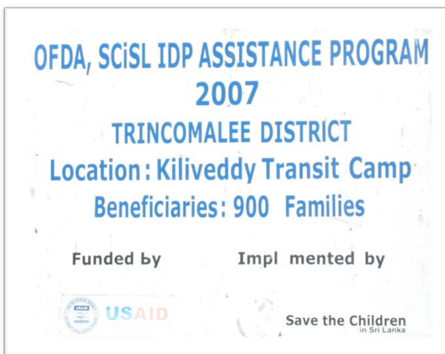
Pancarte devant un camp à Kiliveddi