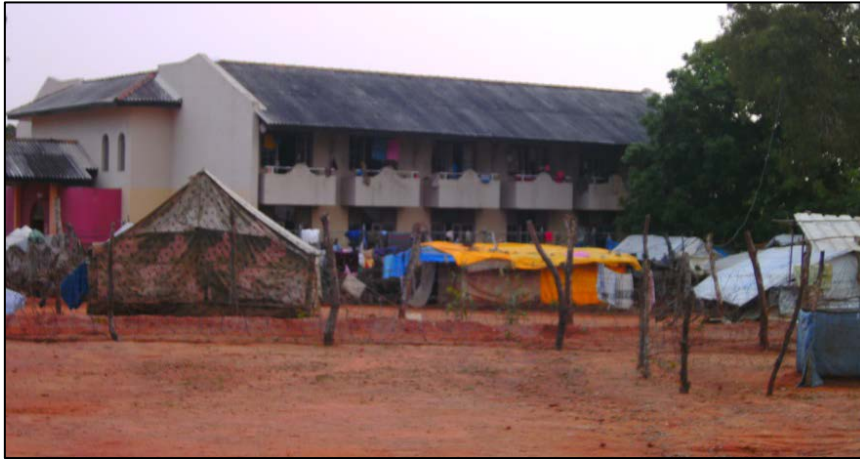
Le PARC de Poonthottam, situé dans le district de Vavuniya en 2011