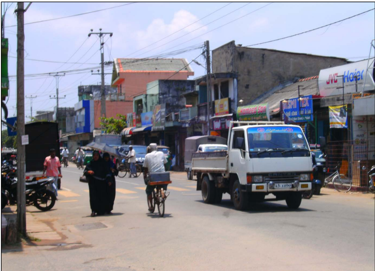
Dans une rue de Puttalam en 2011