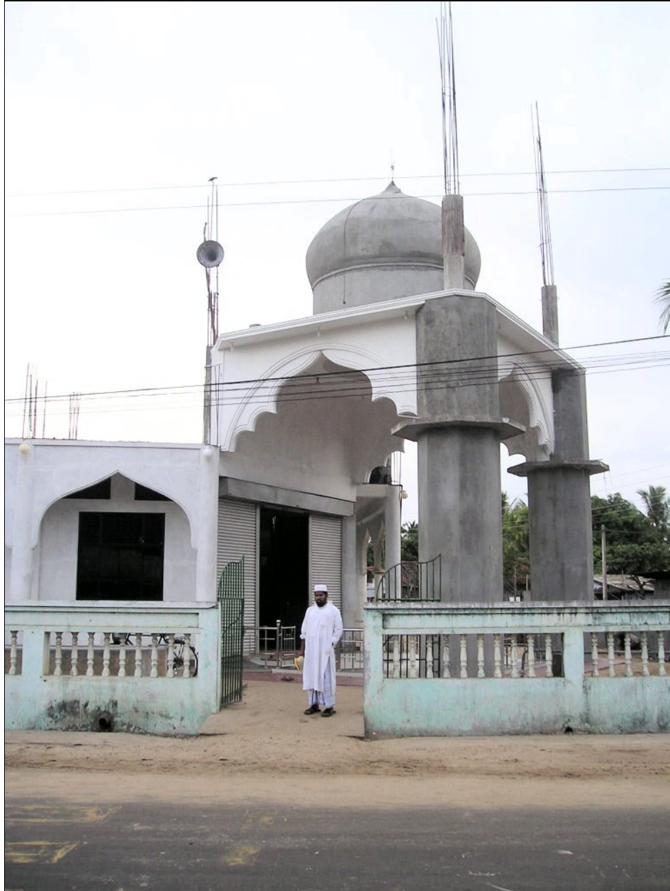
Mosquée en construction à Eravur, province de l'Est, en 2008

dans l'altercation avec le moine et accompagnés par un mollah se sont présentés à la police pour être jugés. 19