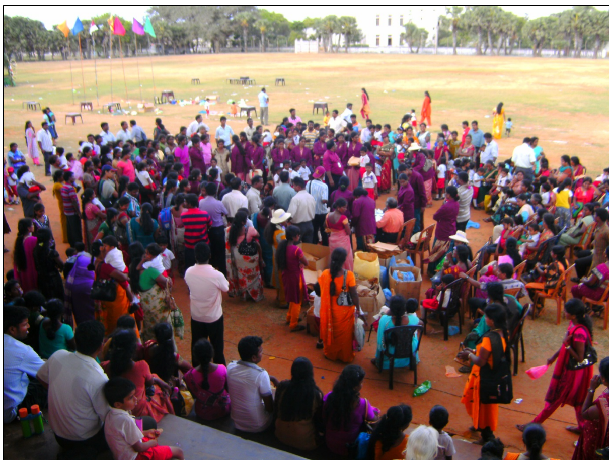
Fête scolaire à Jaffna en 2011