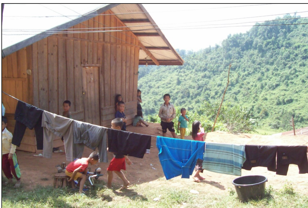
Enfants hmong d'un hameau de bord de route dans la province de Xieng Khouang en 2015