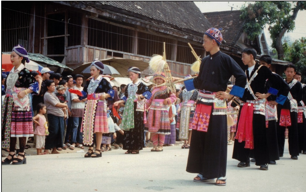
Défilé de Hmong en costumes traditionnels lors du Nouvel An lao à Luang Phrabang en 2000 à la mi-avril (le Nouvel An hmong est en janvier) ; les pièces de monnaie des ceintures et sacs des hommes sont des copies de piastres de l'époque coloniale française

Pour la plupart, les Hmong pratiquent le chamanisme 12 . Certains Hmong ont été convertis au catholicisme, d'autres au protestantisme. Les pratiques chamanistes sont rejetées par les chrétiens. Cependant, les catholiques cohabitent avec les villageois chamanistes, à la différence des protestants évangéliques qui s'isolent dans des quartiers séparés. 13 A la différence des Austro-asiatiques et des Thaïs pour lesquels leur territoire est peuplé de génies avec lesquels ils doivent s'entendre, les Hmong et les Yao n'ont pas de lien spirituel avec le territoire laotien . En revanche, ils sont liés au territoire de leurs âmes, où se trouvent celles de leurs ancêtres et qui est situé dans un endroit mythique en Chine. Cet endroit ne peut être atteint que par un voyage chamanique. Ainsi, la mort annonce le début d'un voyage lointain vers ce territoire. Le culte des ancêtres est au centre de leurs croyances. 14