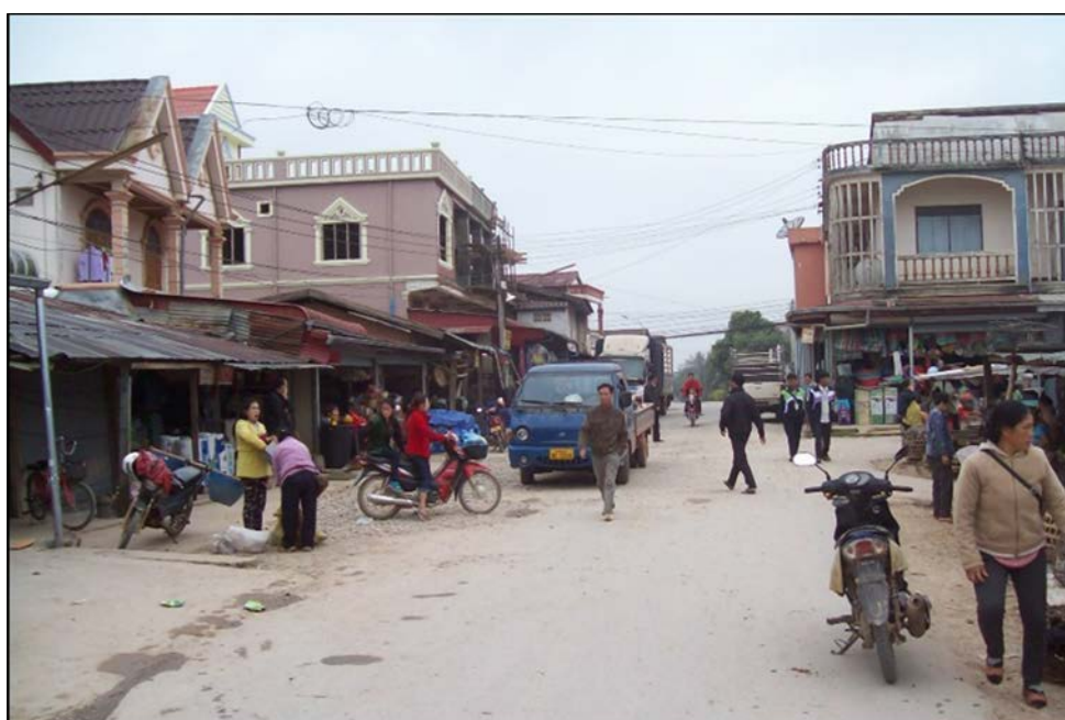
La place du marché de Phonsavan, chef-lieu de la province de Xieng Khouang peuplée en grande partie de Hmong, en 2015