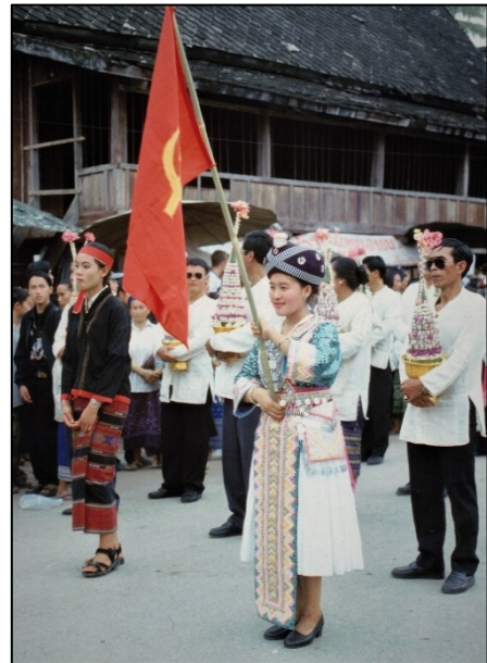
Jeune fille hmong portant un drapeau communiste lors du défilé du Nouvel An lao à Luang Phrabang en avril 2000

Du 11 au 13 janvier 2021, s'est tenu le 11 e congrès du Parti populaire révolutionnaire lao (PPRL), qui a élu l' instance dirigeante réelle de l'Etat , le Bureau politique. Ce dernier est composé de 13 membres, classés par ordre hiérarchique. Le n°3 du Bureau politique du PPRL et donc de l'Etat est une Hmong nommée Pany Yathotou , qui figurait dans le précédent Bureau politique au 5 e rang. 147 Les 22-26 mars 2021, l'Assemblée nationale, totalement contrôlée par le PPRL, parti unique, l'a élue vice-présidente de la République (deux vice-présidents et le président Toungloun Sisoulith, secrétaire général du PPRL, ont été élus lors de cette session, ainsi que le Premier ministre, Phankham Viphavanh, n°2 du Bureau politique, qui est d'ethnie thaïe noire/tai dam). 148 Sous la