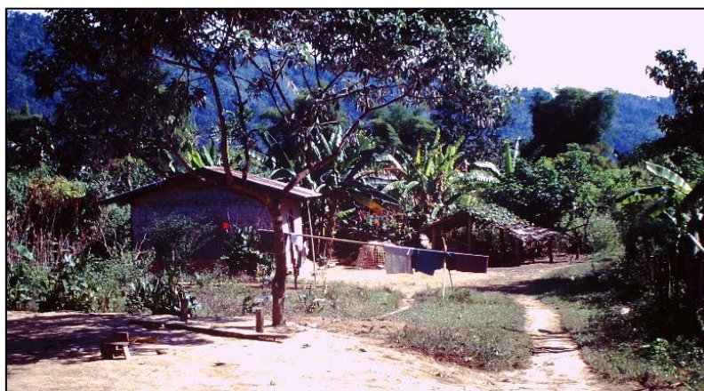
Villages de réfugiés rapatriés hmong : en haut, en 1997, le village en construction de Sisomlack du district de Thakhek dans la province de Khammouane (les Hmong ont pu imposer leur propre plan d'aménagement, en cercle, et leur style d'habitat, et non en rangées et sur pilotis comme les Lao rapatriés du village adjacent,) ; à droite, en 1999, le village de Phathao du district de Vang Vieng dans la province de Vientiane, en fond de vallée