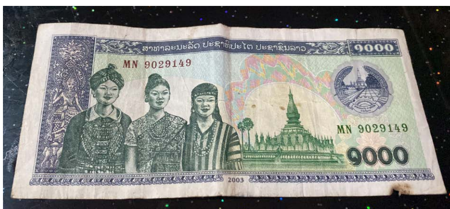
Billet de 1 000 kips de 2003 (coupure très usitée) montrant l'unité des trois familles ethniques : à gauche, une femme hmong représentant les Lao Soung

Cette répartition de la population dans ces trois grands groupes apparaît, non seulement dans l' iconographie du régime, mais aussi systématiquement dans les grandes fêtes nationales organisées par le parti unique, comme, en 2015, lors de la commémoration du 40 e anniversaire de la proclamation de la République démocratique et populaire, où des Hmong apparaissaient en tenues traditionnelles dans le défilé à Vientiane. 142